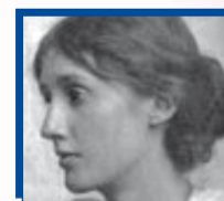
Virginia Woolf Maniodepresivní porucha Spisovatelka