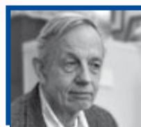
John Forbes Nash Schizofrenie Laureát Nobelovy ceny, ekonom