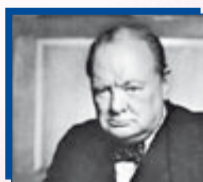
Winston Churchill Deprese Premiér Velké Británie