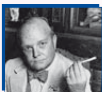
Truman Capote Deprese Spisovatel

Někteří ze známých (a úspěšných) lidí s duševní nemocí