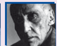
Miloš Kopecký Maniodepresivní porucha Herec