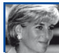
Diana Spencer Porucha příjmu potravy Princezna z Walesu