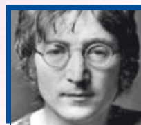
John Lennon Deprese Hudebník