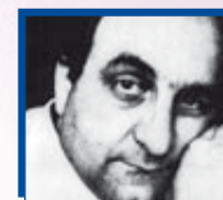
Ota Pavel Maniodepresivní porucha Spisovatel